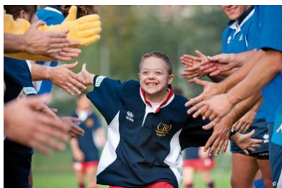
Educazione Fisica e Sportiva per tutti