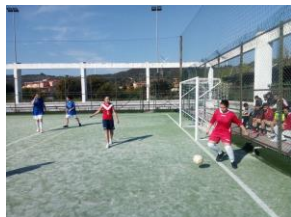
Calcio a 5