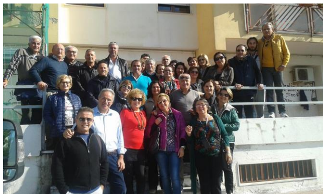
Docenti di Educazione Fisica della Provincia di Crotona